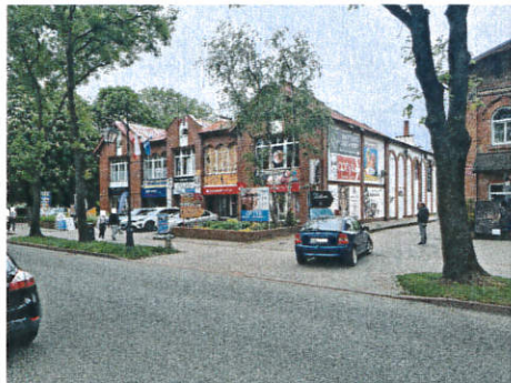
Na tym zdjęciu jest około 30 reklam

Park Kulturowy to również rozwiązania estetyczne: